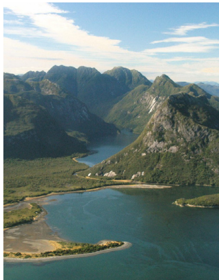
Piti Palena - Área Marina Protegida Anihue