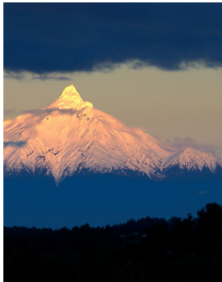
Parque Nacional Corcovado