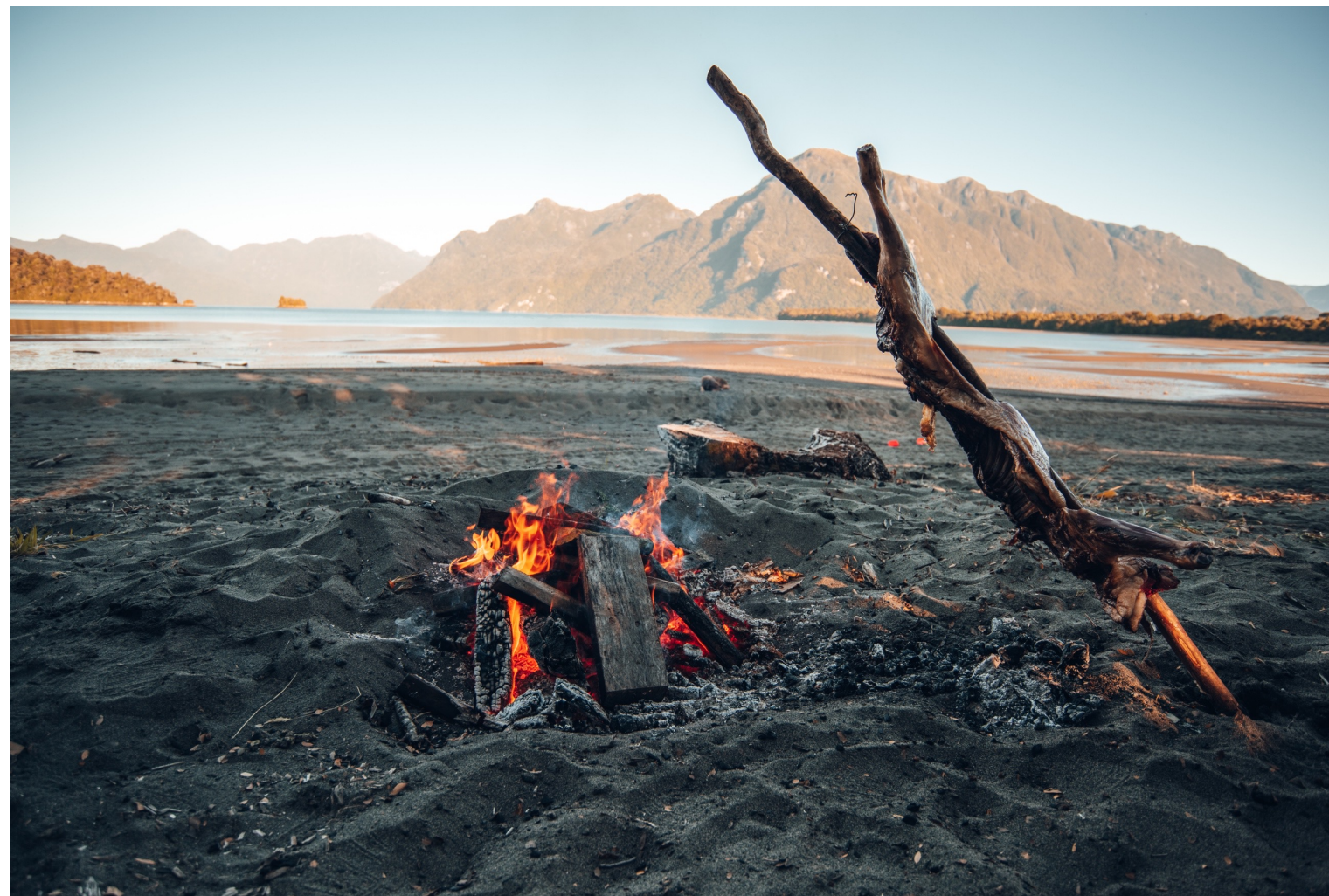
ASADO AL PALO