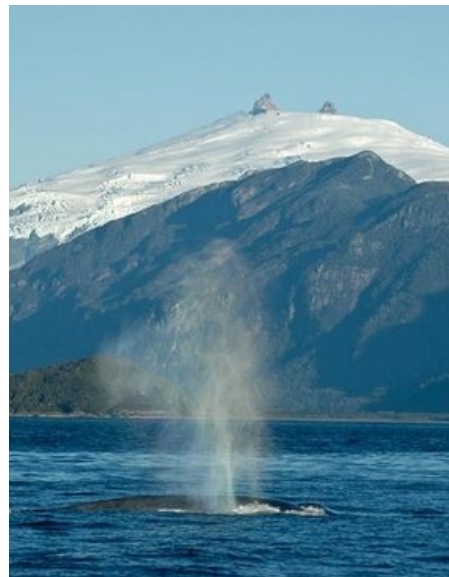
Parque Nacional Melimoyu